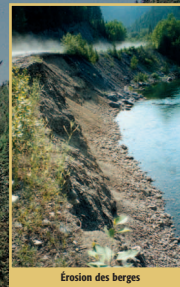
Erosion des berges

L'aménagement ou la restauration d'une frayère vise l'amélioration des conditions de reproduction. Le nettoyage des lieux par l'élimination des sédiments fins et des débris végétaux s'avère souvent la première opération à effectuer. Le succès est directement lié au contrôle des activités qui ont engendré ces détériorations. Les frayères peuvent être créées ou améliorées par l'ajout de substrat d'une granulométrie adéquate et par une modification des conditions hydrauliques du cours d'eau. Des abris et des fosses doivent exister à proximité des sites de fraie.