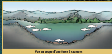
Vue en coupe d'une fosse à saumons

Le changement de débit, l'assèchement, la perte de substrat ou l'accumulation de sédiments fins rendent alors l'habitat impropre à la reproduction. Dans certains cas, un nombre insuffisant de frayères pour assurer la reproduction optimale d'une rivière peut agir comme facteur limitant.